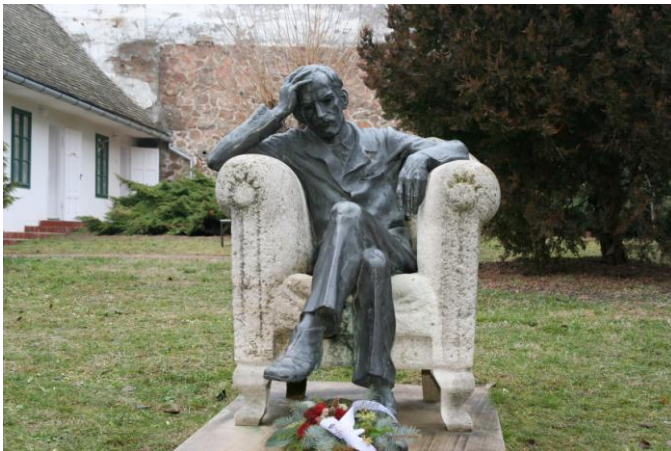
Babits Mihály szobra