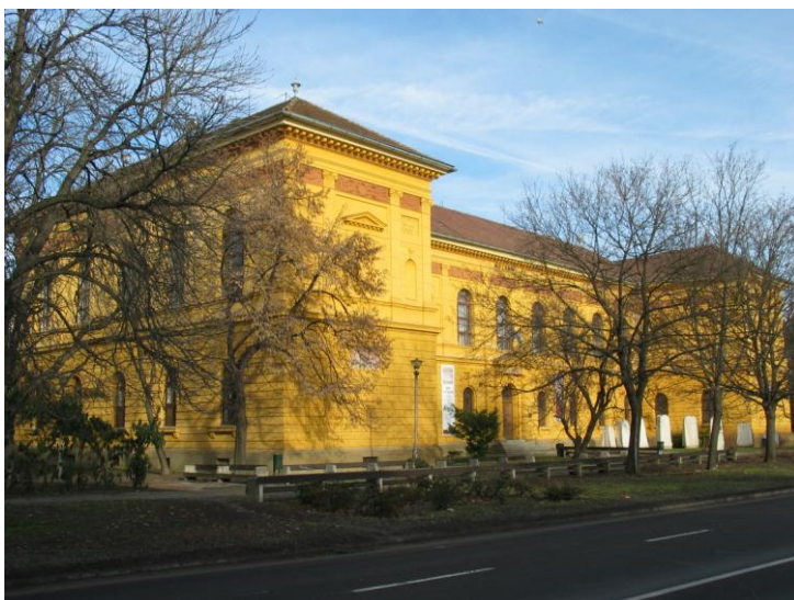
Wosinszky Mór Megyei Múzeum

Versenytáv: kb. 10 km, szintkülönbség: kb. 400 m