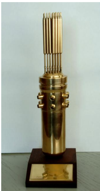
A találkozó fődíja, a „C” tagozat győztesének jutalma, a Reaktor

A jelentkezési lapok másolhatók, a Találkozó hivatalos honlapjáról letölthetők.